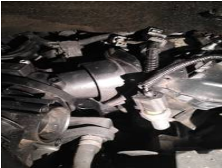
Moteur (Fuite d'huile)