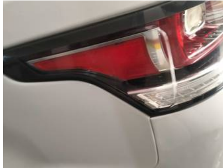
Phare arrière gauche (Autre Défaut)