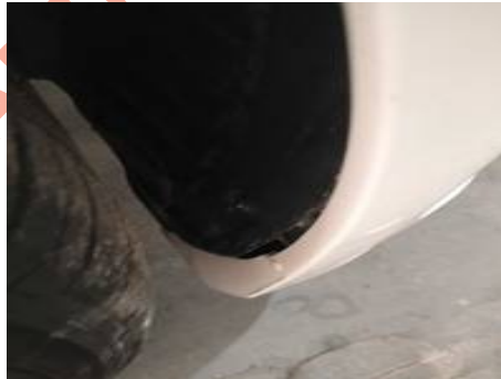
Bouclier avant (Autre Défaut)