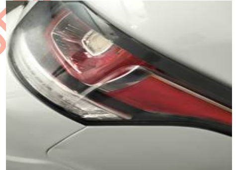
Phare arrière droit (Autre Défaut)