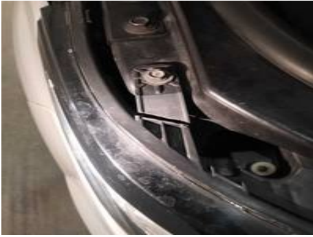
Phare avant droit (Impact)